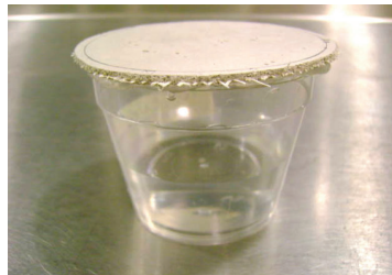
Prueba de Permeabilidad