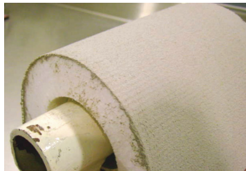
Prueba de Resistencia a la flexión